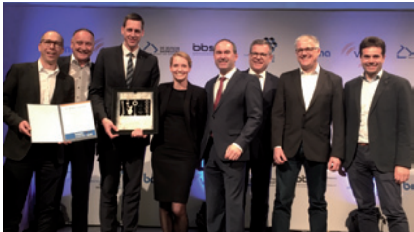
Max Bögl Wind AG

Die Idee hinter dem weltweit einzigartigen Konzept ist es, die Produktion von hybriden Windkrafttürmen, einer Kombination aus Betonelementen und Stahlsegmenten, direkt am Windkraftanlagenstandort durchzuführen. Die aufgebaute mobile Fertigung besteht aus vier Hallen, einer Wasseraufbereitungsanlage sowie Betonmisch- und Schleifanlage auf einer Grundfläche von 40.000 m 2 – umgerechnet zehn Fußballfeldern. Die Vorteile sind klar erkennbar: Lokale Rohstoffe und Arbeitskräfte machen die Hybridtürme zu „local content“ und steigern die Wirtschaftlichkeit des Projekts. Weniger Schwertransporte schonen die Infrastruktur, das Klima und die Umwelt. Die hohen Qualitätsstandards der deutschen Werksfertigung bleiben dabei erhalten.