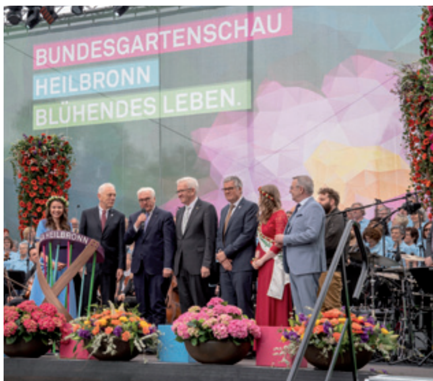
Eröffnung der BUGA 2019 in Heilbronn durch Bundespräsident Steinmeier.

Bundespräsident Frank-Walter Steinmeier hat in Anwesenheit zahlreicher prominenter Vertreter aus Politik, Wirtschaft und Gesellschaft am 17. April 2019 die diesjährige Bundesgartenschau in Heilbronn eröffnet. Bis zum 6. Oktober 2019 können sich die Besucher in außergewöhnlichem Umfang auch über hochwertige Lösungen mit Betonbauteilen informieren. So zeigen regionale Mitgliedsunternehmen wie die Kronimus AG oder die Rinn Beton- und Naturstein GmbH & Co. KG nachhaltige und attraktive Flächenbeläge, Gestaltungselemente und Möbel aus Beton. Die Birco GmbH und die Hauraton GmbH & Co. KG präsentieren moderne Entwässerungslösungen. Das Unternehmen Birkenmeier Stein + Design GmbH stellt seine innovativen Gartenhäuser vor.