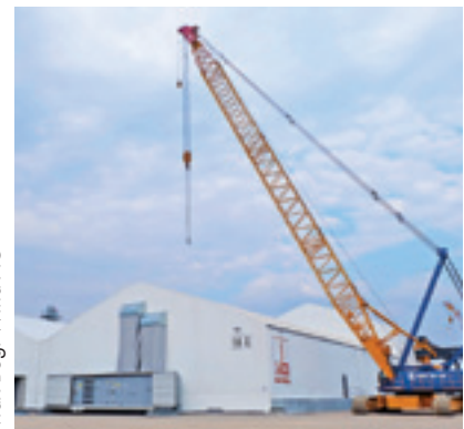
Max Bögl Wind AG

Das Herzstück der mobilen Fertigung ist die CNC-Betonschleifanlage. Sie stellt sicher, dass die Betonsegmente des