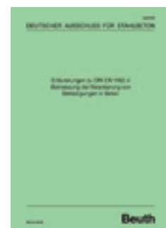
Das neue Heft 615 erscheint nach Veröffentlichung von DIN EN 1992-4.

Der dritte Teil des Heftes enthält Beiträge, die von Mitgliedern des UA Befestigungstechnik in eigener Verantwortung verfasst wurden und weitergehende Erläuterungen zu ausgewählten Themenkreisen beinhalten. Die Beiträge entstammen im Wesentlichen der Mitarbeit der Verfasser in den Arbeitsgruppen zur Erarbeitung der EN 1992-4. Die Beiträge behandeln insbesondere Anwendungsfälle, die in EN 1992-4 nicht abgedeckt sind, und bieten ingenieurmäßige Lösungen an.