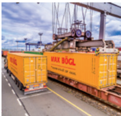
Max Bögl Wind AG

Serielle Fertigung direkt am Projektstandort.