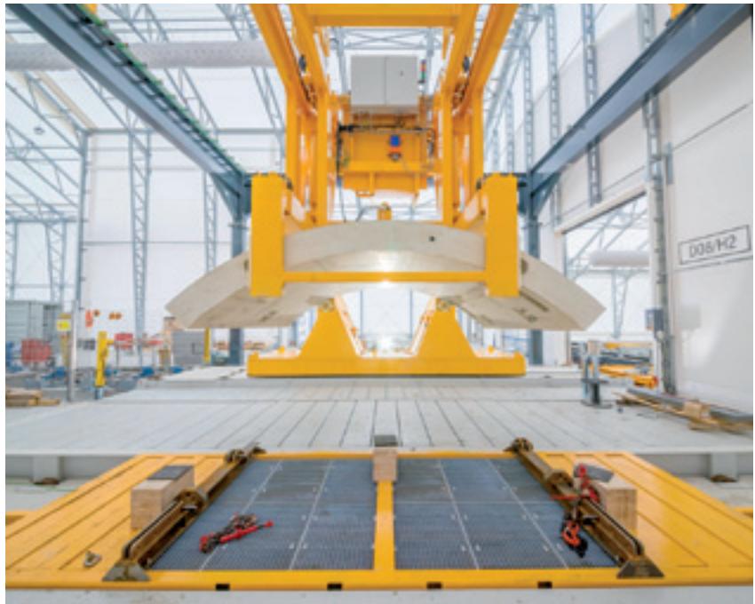
Max Bögl Wind AG

Alle drei Jahre zur bauma loben der Verband Deutscher Maschinen- und Anlagenbau (VDMA), der Hauptverband der Deutschen Bauindustrie (HDB), der Zentralverband des deutschen Baugewerbes (ZDB), der Bundesverband Baustoffe – Steine und Erden (bbs) und die Messe München den bauma Innovationspreis aus. Diesmal gingen 138 Bewerbungen ein, davon 64 % aus dem Inland und 36 % aus dem Ausland. Die Bewerber müssen sich in mehreren Auswahlrunden qualifizieren und bestimmte Kriterien erfüllen.