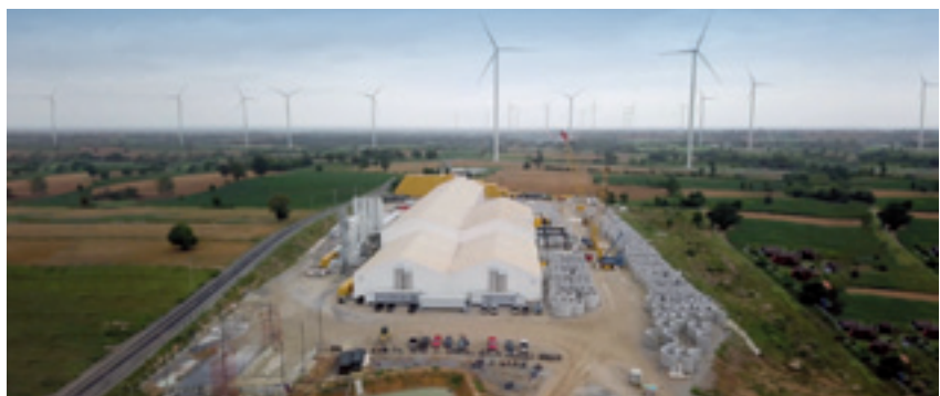
Max Bögl Wind AG