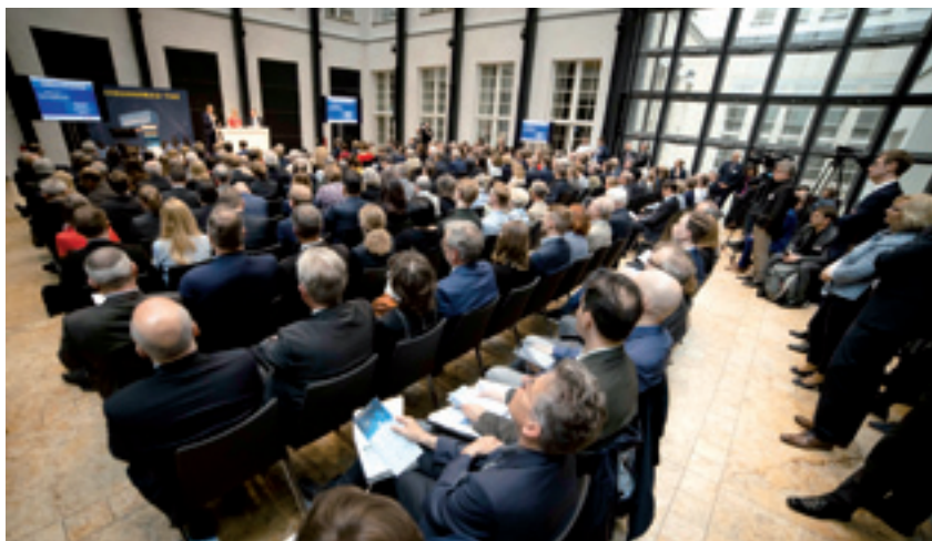
Impulse für den Wohnungsbau

„Vieles wird aber auch zerredet und verhindert“, merkte Wanderwitz an und bezog sich dabei auf den Gesetzentwurf zur steuerlichen Förderung des Mietwohnungsbaus. Die Entscheidung darüber wurde vom Bundesrat vertagt. Von einem „Totalversagen der Länder“ sprach er im Zusammenhang mit dem sozialen Wohnungsbau. Viele Länder hätten in der Vergangenheit die vom